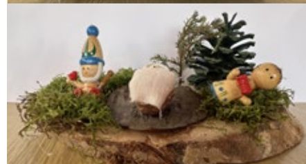
Vracíme se ještě k prosincovým výstavám betlémů, které v rámci tvořivé dílničky vytvořily naše děti.