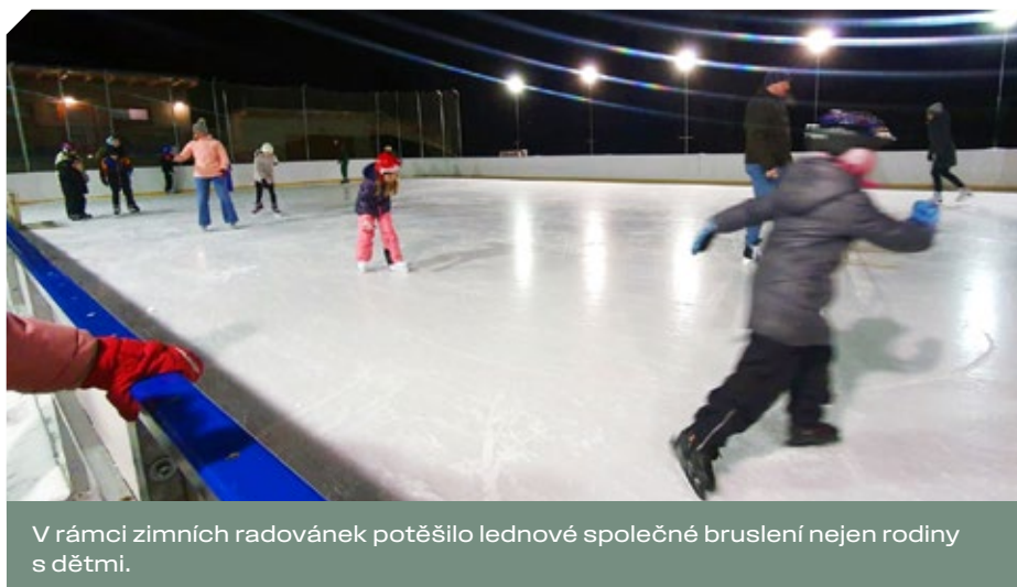
V rámci zimních radovánek potěšilo lednové společné bruslení nejen rodiny s dětmi.

Aktuální dění můžete sledovat prostřednictvím obecních sociálních sítí na Facebooku a Instagramu.