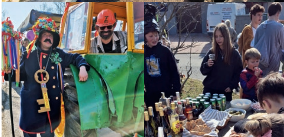
Masopustní průvod na začátku března s pestrobarevnými maskami rozveslil naše ulice za doprovodu lidové hudby.