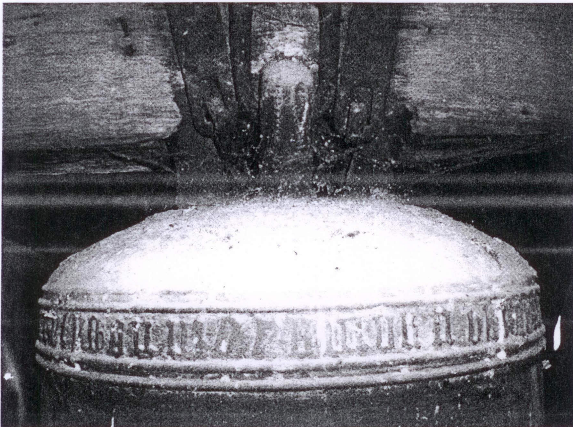
Obr. 2 Detail koruny, vyklenutého čepce a pod ním mezi dvěma zdvojenými linkami obíhajícího tzv. enigmatického nápisu gotickou minuskulí.